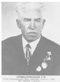
КРИЖАНІВСЬКИЙ С.Ф. Ім'я Степановича Федоровича Крижанівського В.І. ЛЕНИНА в Україні

(27.12.1912, с. Педоси Хмельницького району – 08.06.1976 р., м. Кустанай, республіка Казахстан)