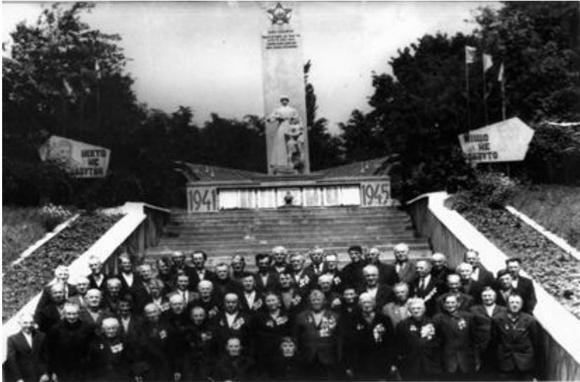
Фото. Земляки серед воїнів-визволителів

Хмельниччина пам'ятає, гордиться воїнами, які в грізні роки війни боролись проти нацизму.