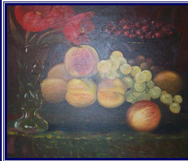
«Натюрморт». 1985. Картон, олія

Хмельницька обласна універсальна наукова бібліотека