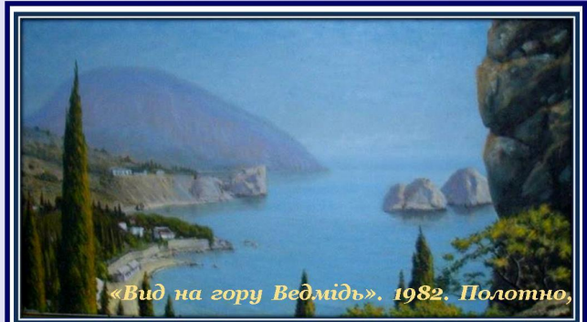
«Вид на гору Ведмідь». 1982. Полотно,

Свої краєвиди він наповнив світлом, вологим і солоним морським повітрям, блиском води, прозорими тінями; показав не тільки зовнішній вигляд цієї природи, але і її подих, рух, життя.