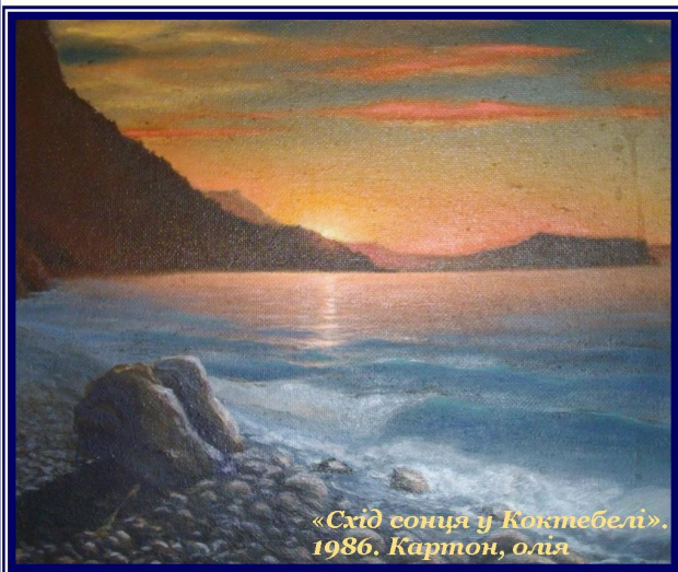
«Схід сонця у Коктебелі». 1986. Картон, олія

Народився 20 травня 1943 року в Криму. З дитячих років проживає на Поділлі.