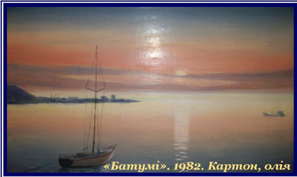
«Батумі». 1982. Картон, олія