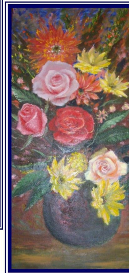
«Квіти». 2005. Картон, олія