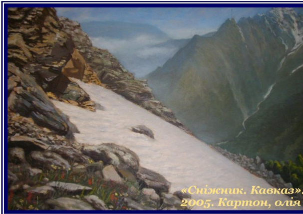
«Сніжник. Кавказ». 2005. Картон, олія

Окремі картини зберігаються в приватних колекціях України і зарубіжжя.