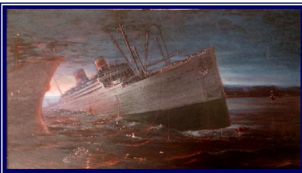
«Адмірал Нахімов». 2000. Картон, олія