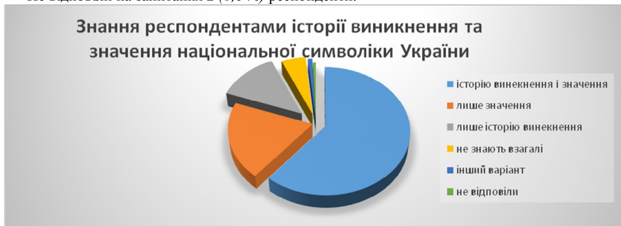
Мал. № 4. Діаграма: «Динаміка знань респондентами історії виникнення та значення національної символіки України».