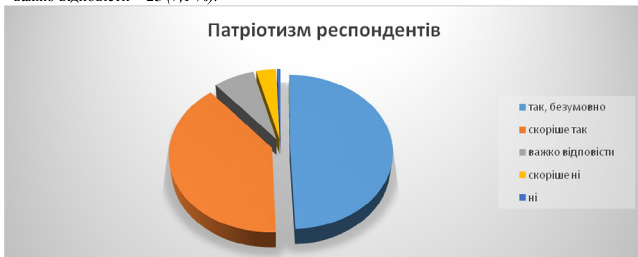
Мал. № 3. Діаграма: «Думка респондентів щодо свого патріотизму».

На запитання: «Кого з сучасників Ви б назвали справжнім патріотом України?» (вказіть конкретно особистість), респонденти відповіли: