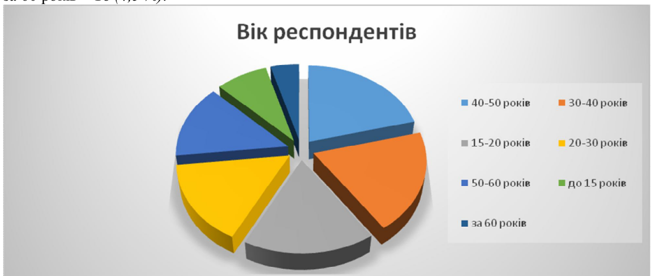
Мал. № 1. Діаграма: «Розподіл респондентів за віком».