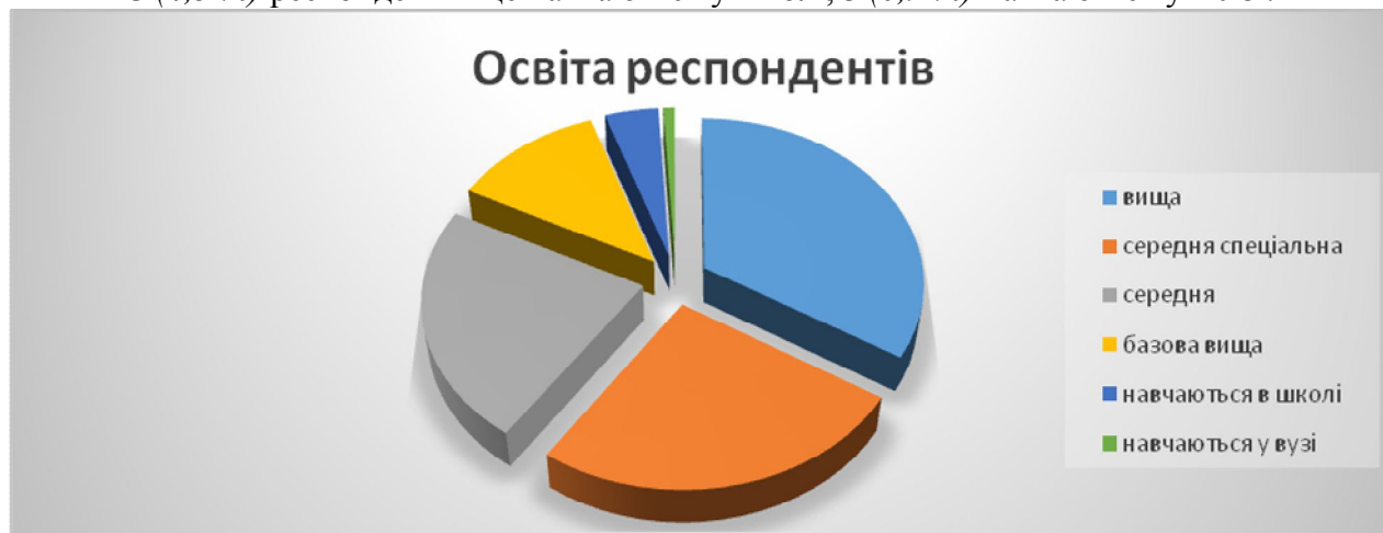
Мал. № 2. Діаграма: «Розподіл респондентів за освітою».

15 (4,3 %) респондентів ще навчаються у школі, 3 (0,9 %) навчаються у ВУЗі.