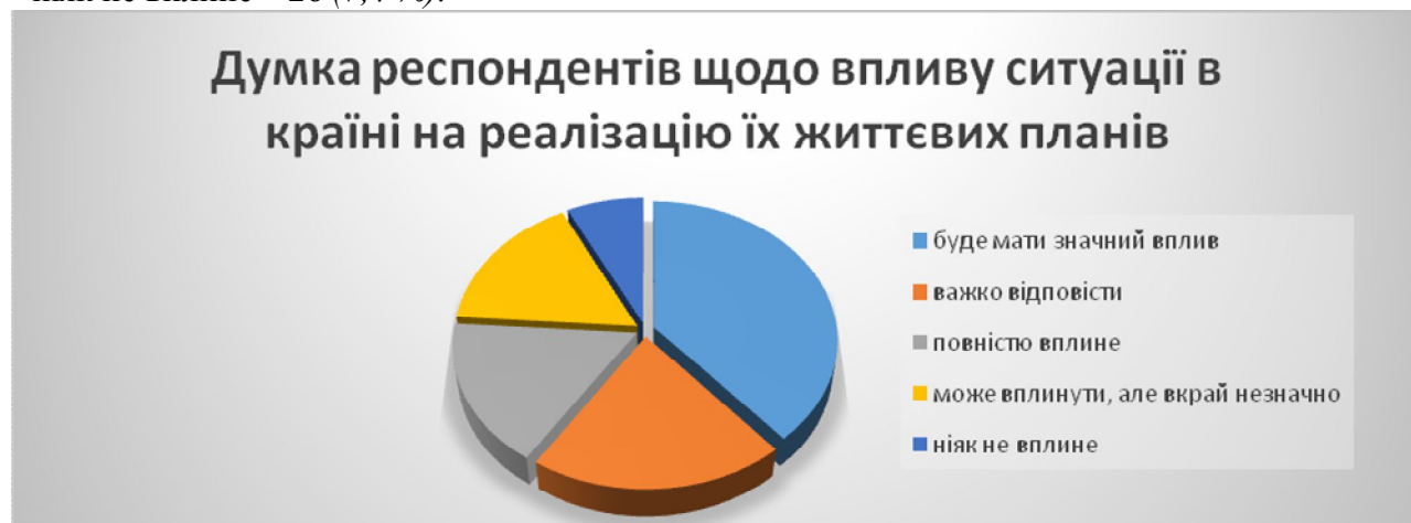
Мал. № 5. Діаграма: «Динаміка думки респондентів, щодо впливу ситуації в країні на реалізацію життєвих планів».

На запитання: «Як Ви гадаєте, чи потрібно виховувати патріотизм у молоді?» респонденти вказали: