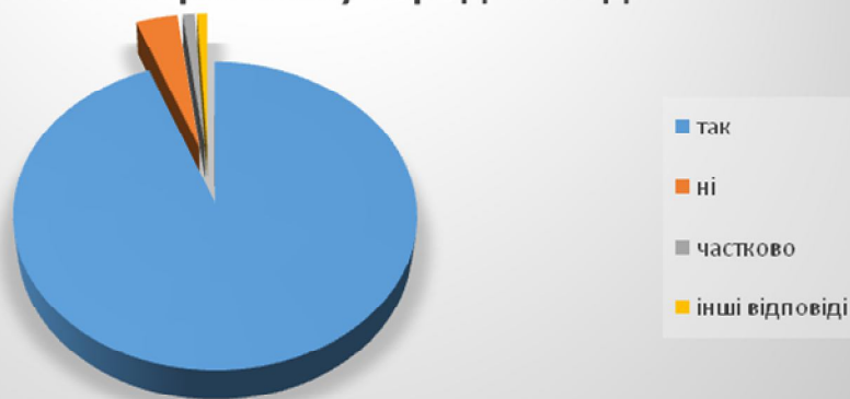
Мал. №7. Діаграма: «Динаміка думки респондентів щодо впливу бібліотеки на розвиток патріотизму серед молоді».

На запитання: «Які кроки, на Вашу думку, може зробити бібліотека для розвитку цього напрямку?» респонденти вказали: